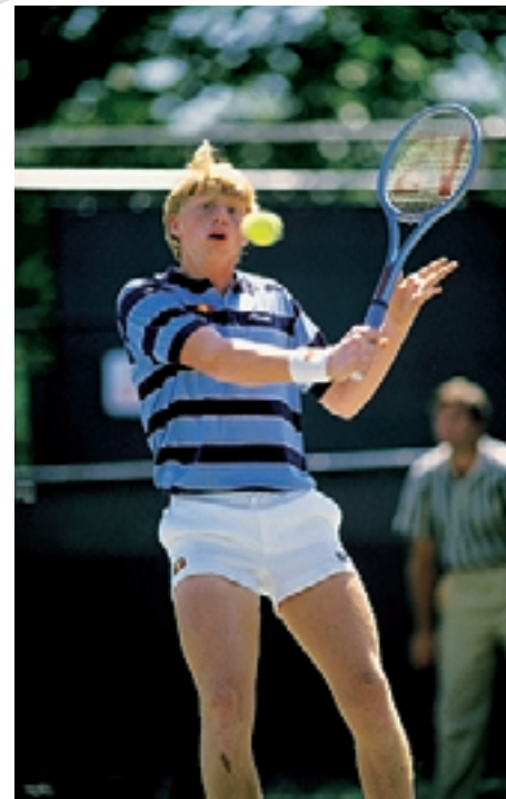
Boris Becker – In der Jugend nicht überragend, später aber dreimal Wimbledon-Sieger