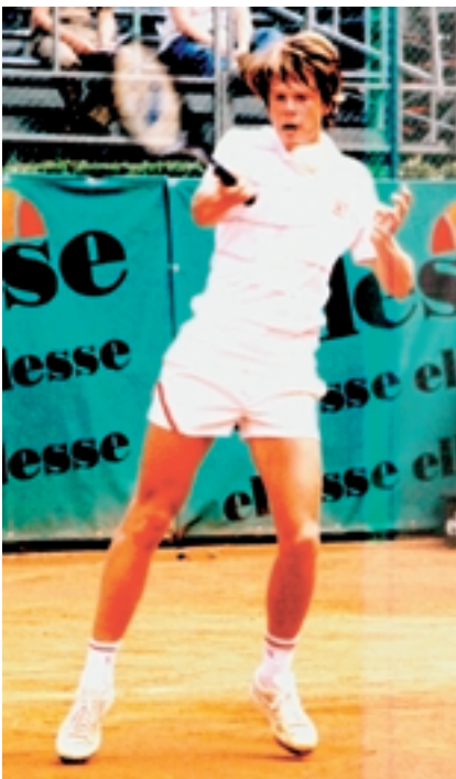
Stefan Edberg – Nummer 1 bei den Junioren und später Nummer 1 bei den Profis

Wer hat das nicht schon erlebt: Man sieht einen talentierten Jugendlichen spielen, er oder sie hat vielleicht schon die eine oder andere Meisterschaft gewonnen, und man fragt sich: „Wird man dieses Gesicht vielleicht bald in der Weltspitze sehen?“ oder: „Schafft er oder sie es zumindest zum Durchschnitts-Profi?“ Wie gut muss ein Jugendlicher eigentlich sein, um später einmal in Wimbledon oder bei den French Open antreten zu können? Ist ein Deutscher Jugendmeister schon auf dem besten Weg ins Davis Cup Team? Und im Umkehrschluss: Kann jemand, der nicht unter den nationalen Top 3 seines Jahrgangs ist, die Profikarriere schon abschreiben?